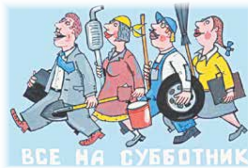
ВСЕ НА СУББОТНИК